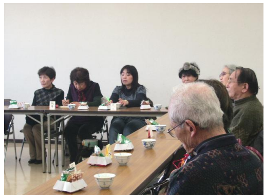
色々の話ができました